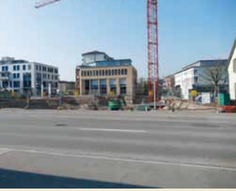
Hauptstrasse © 2022 Monika Meier