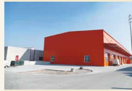
Gewerbstrasse