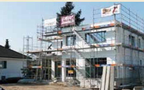
Schulhausstrasse