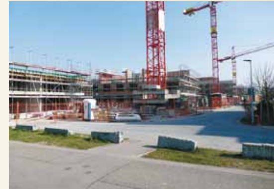
Enzianweg