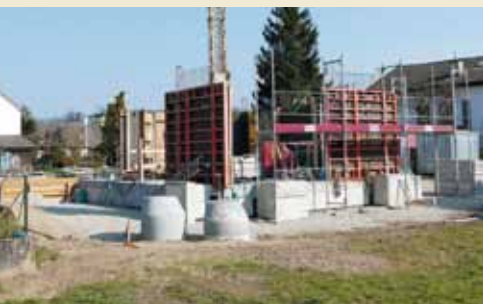
Schulhausstrasse