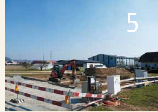
Aareweg

Die Kontaktaufnahme erfolgte telefonisch (39), persönlich auf der Beratungsstelle (7) oder per E-Mail (2).